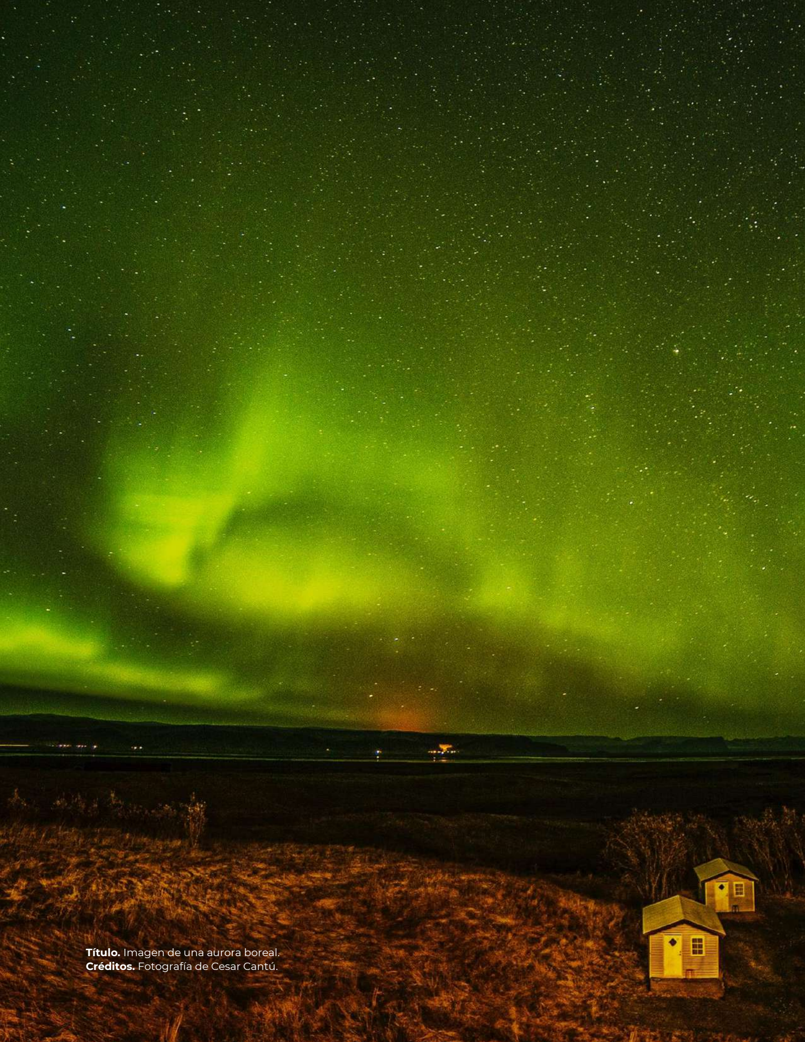
Título. Imagen de una aurora boreal.